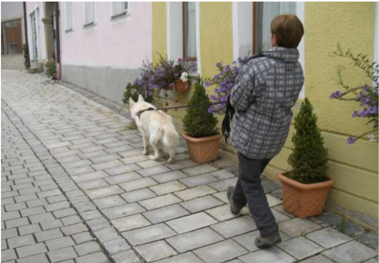
Auf die Plätze...wo ist er?